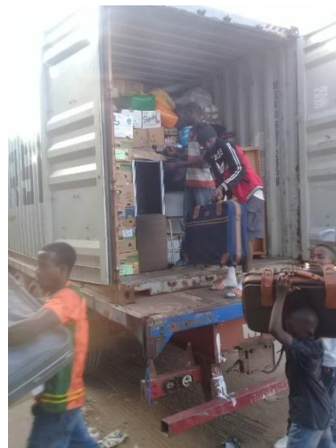
een container wordt uitgeladen

Het afgelopen jaar is er een mooie wachtruimte bij het ziekenhuis gebouwd, de vrouwen die met hun baby's soms uren in de brandende zon naar de kliniek lopen kunnen nu in een prachtige overdekte ruimte op hun beurt wachten. Het gebouw dient ook als een bijeenkomst plaats voor de lokale bevolking waar feesten, vergaderingen en andere activiteiten kunnen plaats vinden.