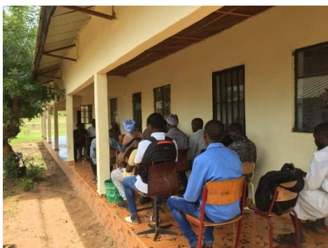
ceremonie opening school