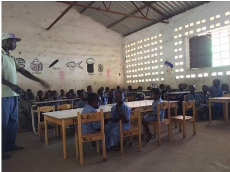
de gedoneerde schoolmeubels

De Beatrixschool uit Ermelo heeft gebruikte tafels en stoeltjes gedoneerd, het schooltje in Toniataba is er enorm blij mee.