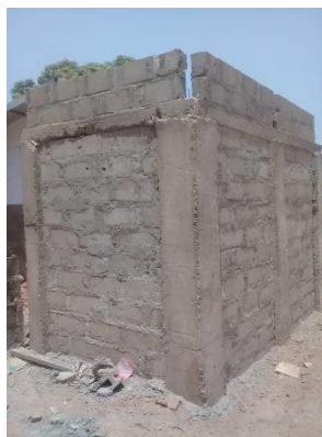
onderstel watertanks groentetuin

Als volgende project staat op het programma het bouwen van 2 nieuwe klaslokalen, een computerlokaal en een bibliotheek, met daarbij een kantoor voor het hoofd van de school.