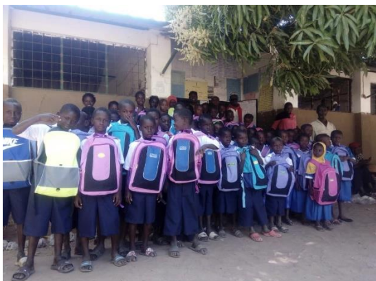
kinderen in schooluniform