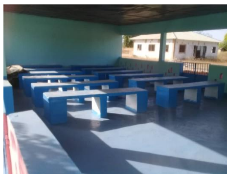
de wachtruimte voor het ziekenhuis

Het project in Nederland van de jute en vilten tassen gaat nog steeds door en er zijn inmiddels meer dan 1000 tassen gemaakt. Daarbij is het assortiment uitgebreid met schorten in allerlei maten en soorten. De opbrengst van de verkoop van deze producten gaat nog steeds naar de uniformen, schoenen en schooltassen voor de kinderen op de school in Toniataba.