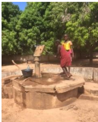
de oude waterpomp

De school had nog een waterpomp die met de hand bediend moest worden en die zeer gammel was, er komt nu een elektrische waterpomp die de school en de daarbij gelegen groentetuinen van water gaat voorzien. Daarbij worden er 2 betonnen watertanks gebouwd voor opslag van water voor de tuinen. Momenteel worden er zonnepanelen geïnstalleerd om dus niet alleen elektriciteit op te wekken voor de school, het lerarengedouw en de kliniek, maar ook voor de elektrische waterpomp bij de school.