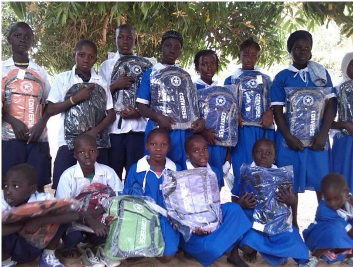
1KINDEREN MET SCHOOLUNIFORMEN